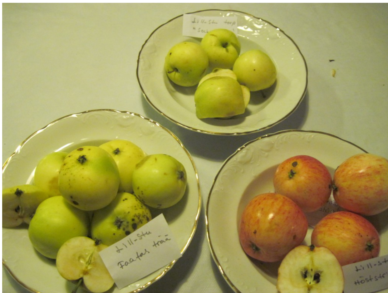
Lill-Stu 2: Höststrimling