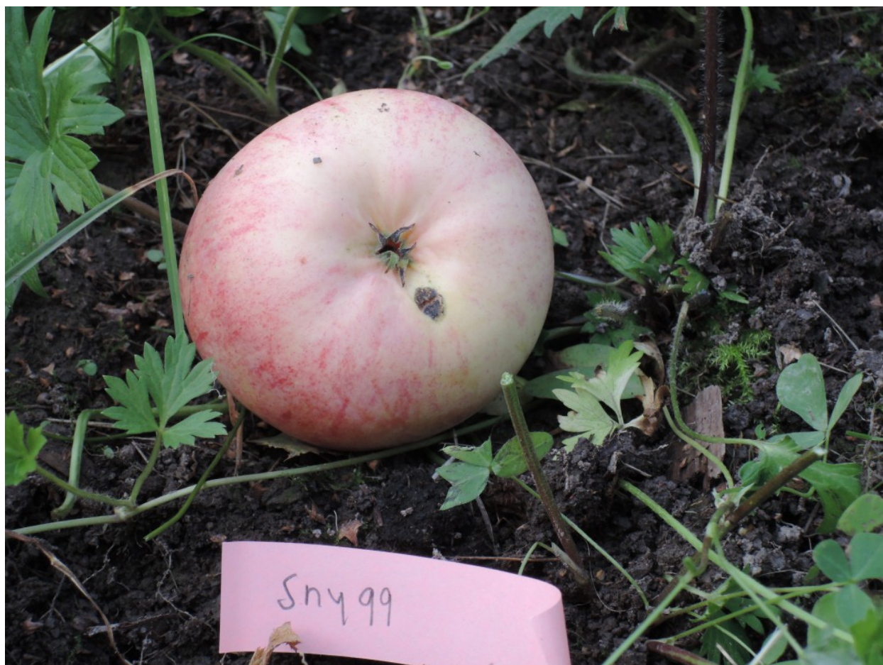
Gamla Marieberg 1, Joufs 1: Risäter