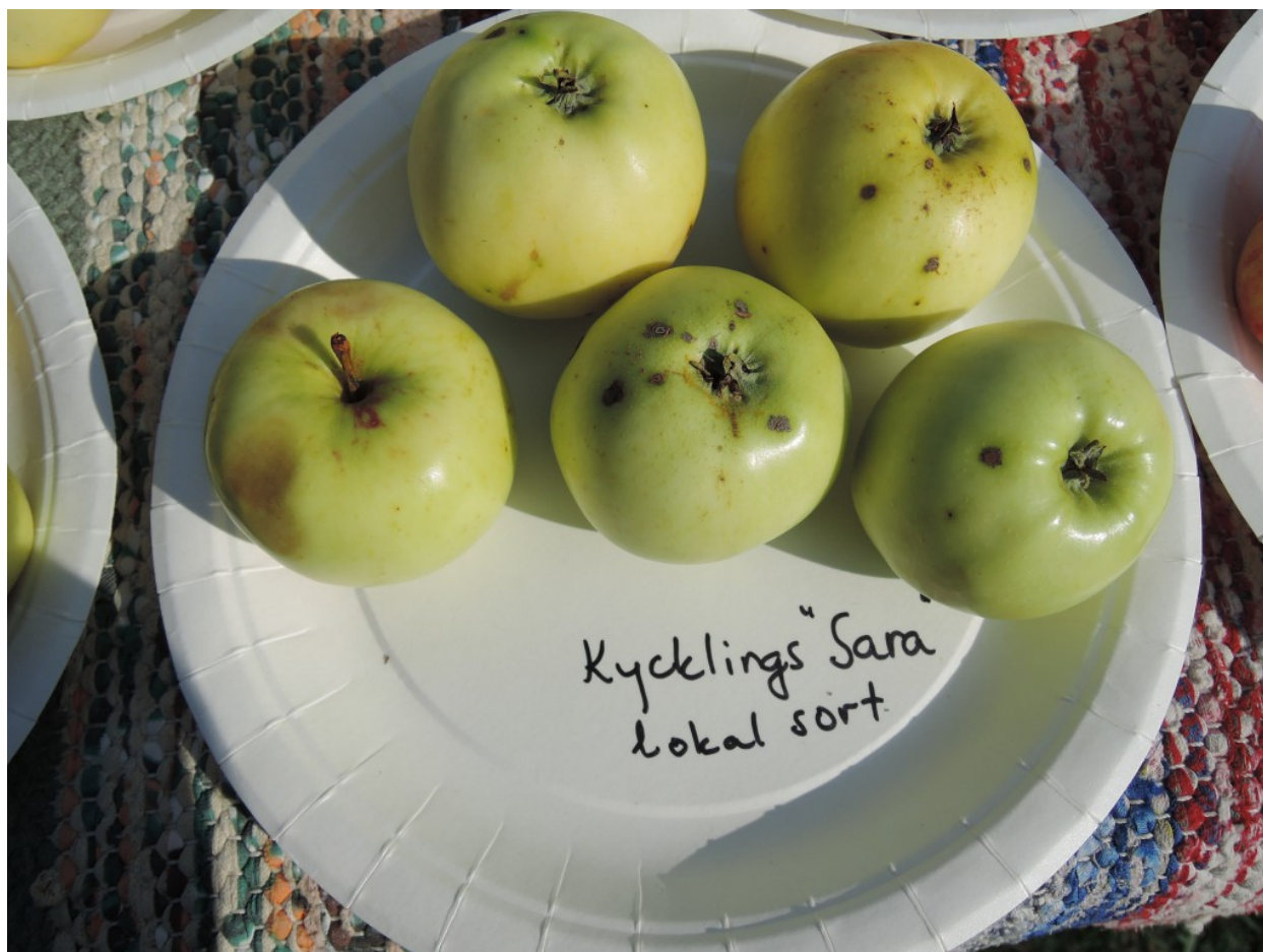
Tallberg-Mickels 2: Okänd sort, kan vara Revals Päron