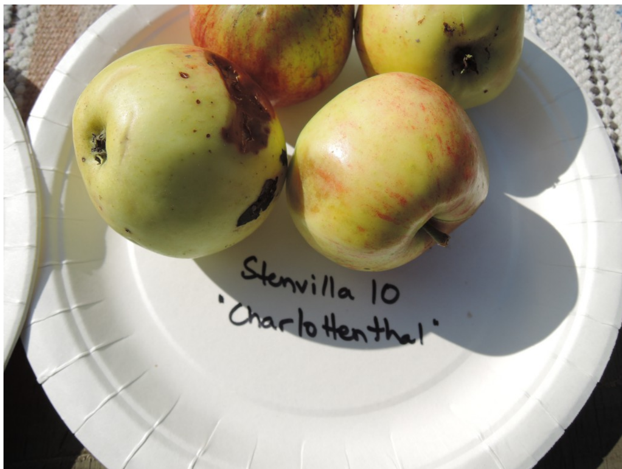
Stenvilla 11: Borovinka.