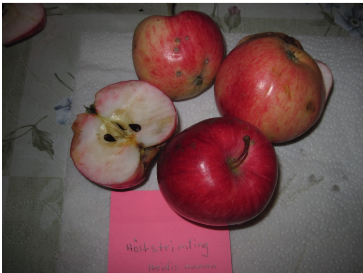
Gamla Marieberg: Snygg