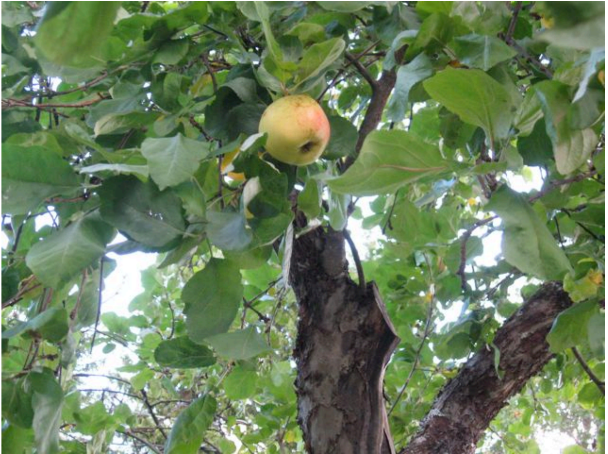
Stenvilla 10: Charlottenthal.