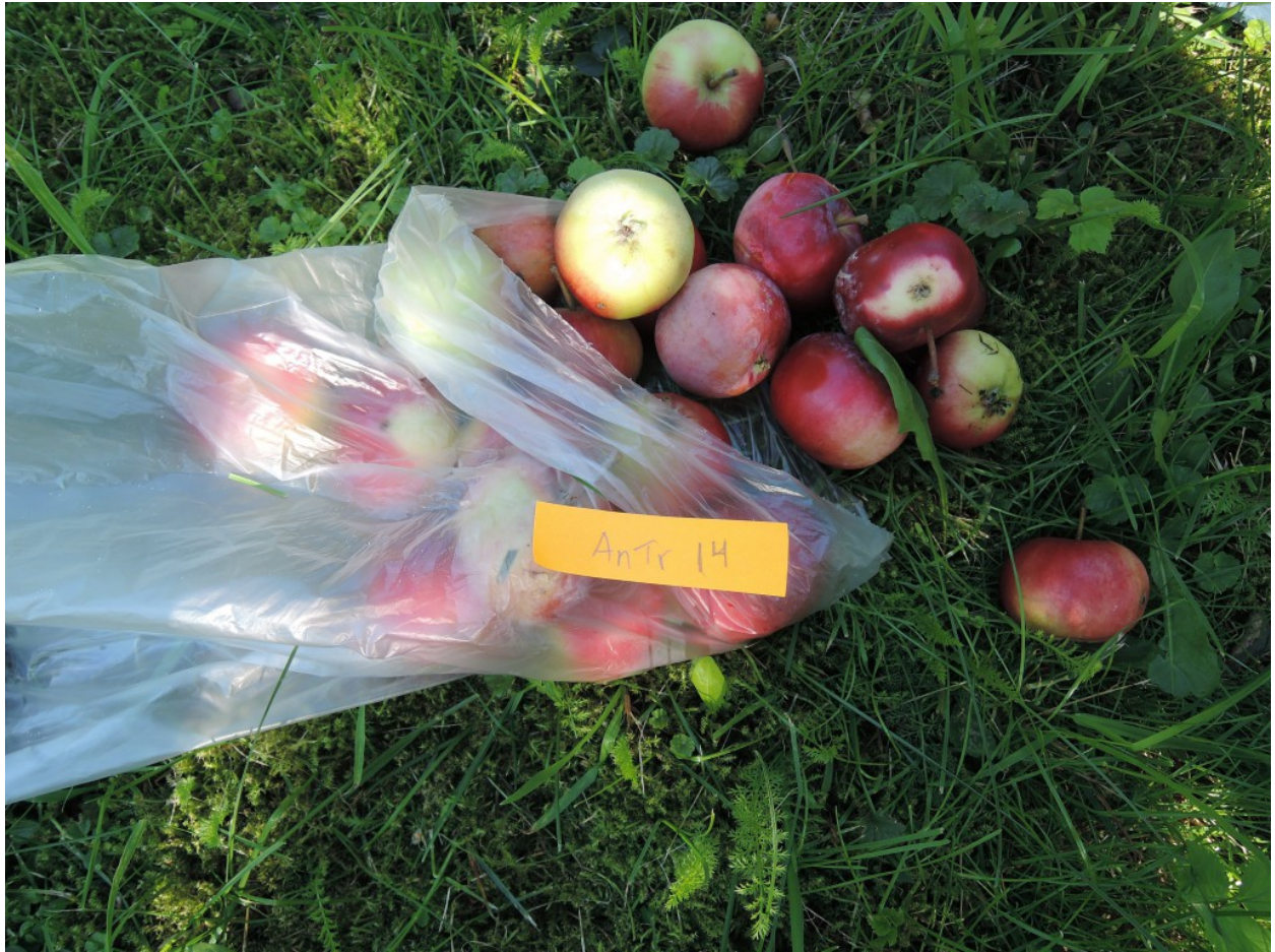
Lill-Stu 1: Faafas Trä.