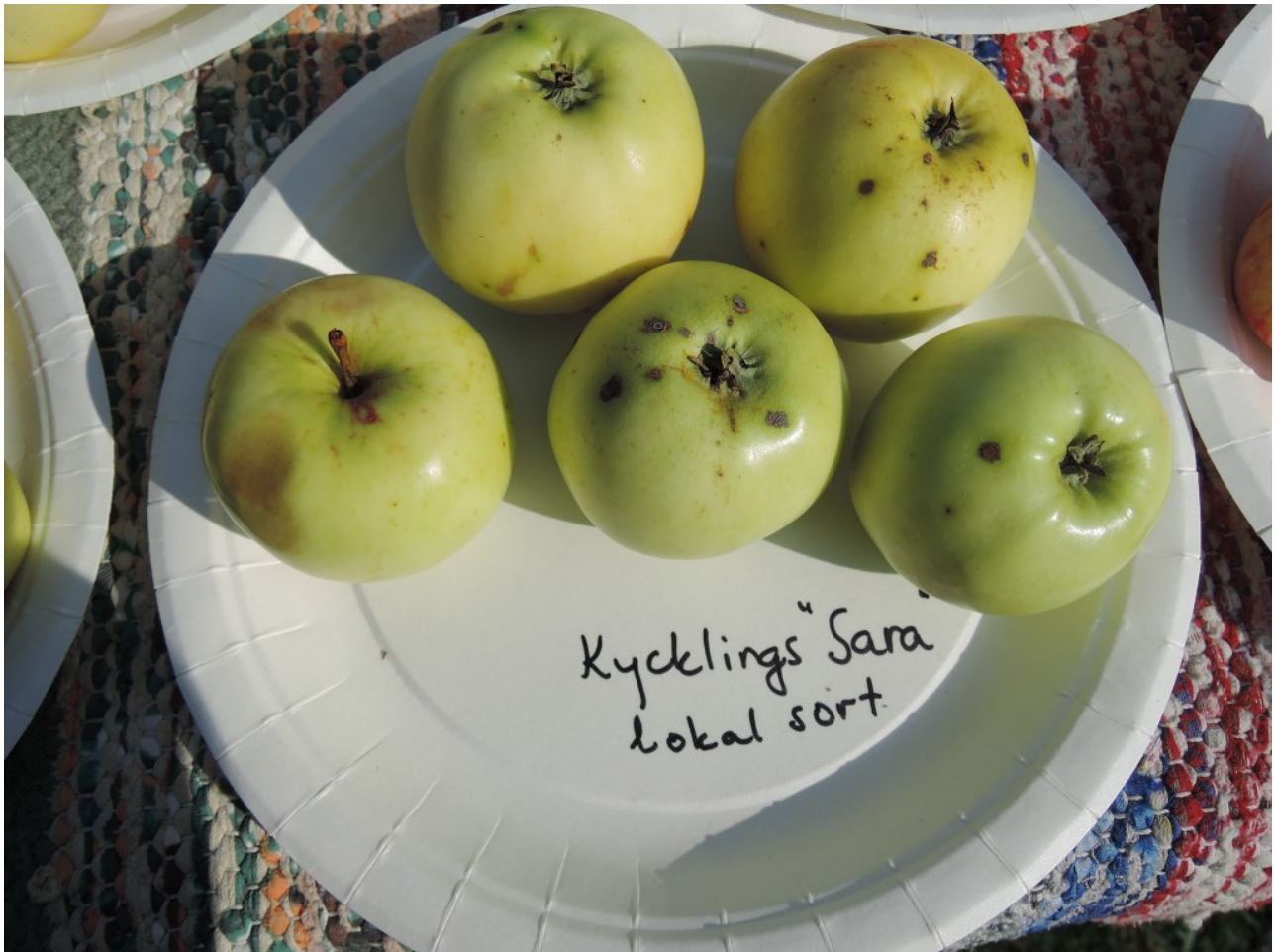
Tallberg-Mickels 2: Okänd sort, kan vara Revals Päron