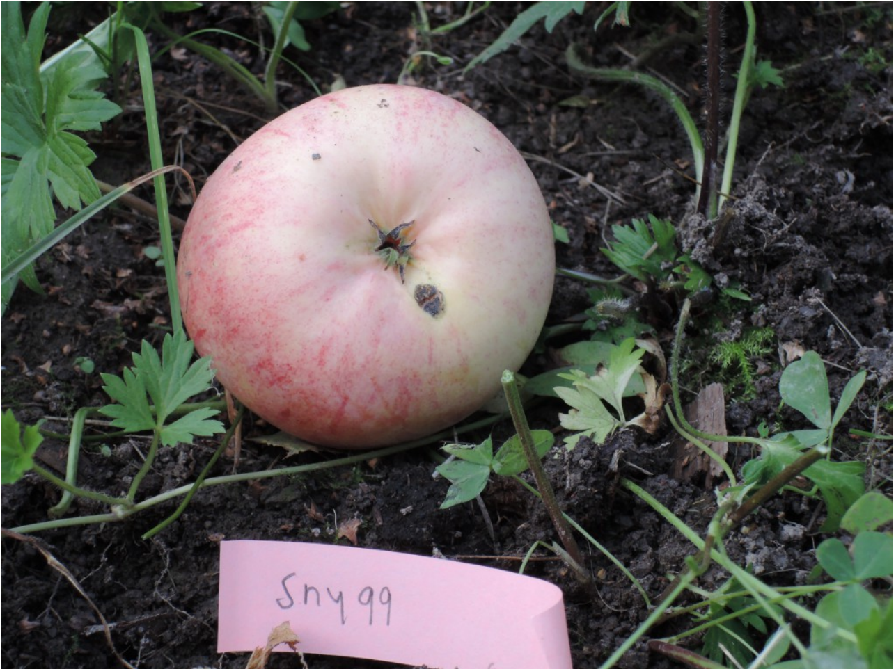
Gamla Marieberg 1, Joufs 1: Risäter