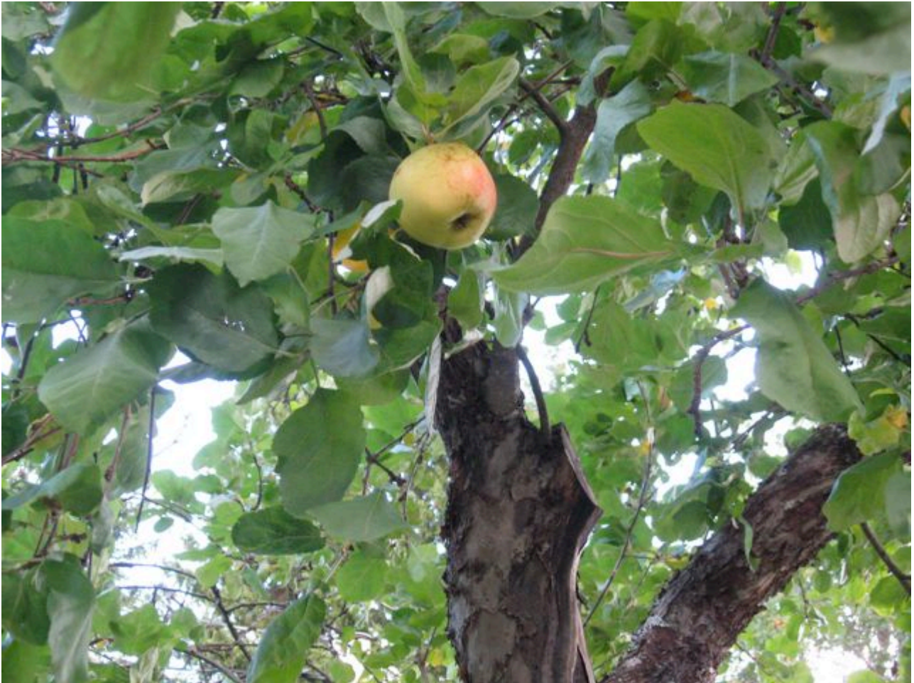
Stenvilla 10: Charlottenthal.