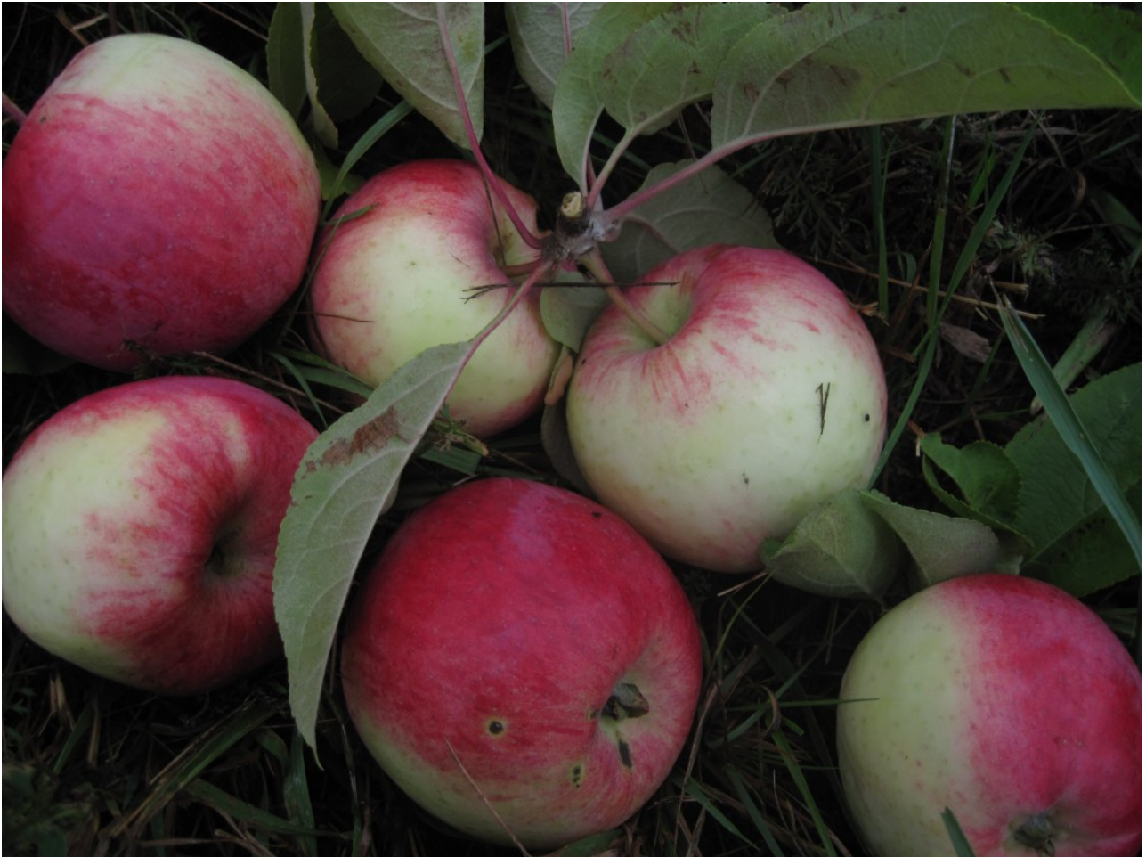
Sointula 1: Atlas?