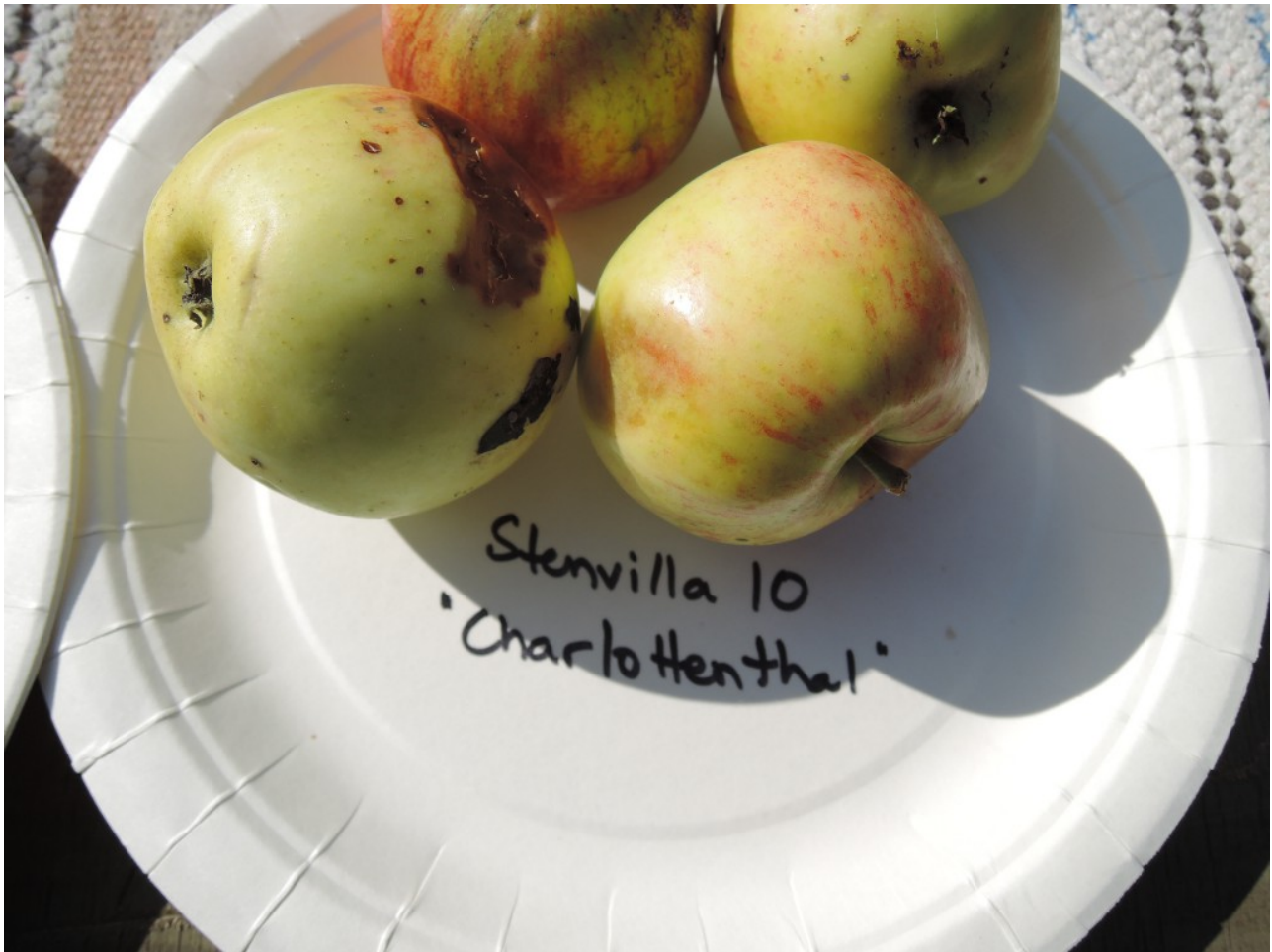
Stenvilla 11: Borovinka.