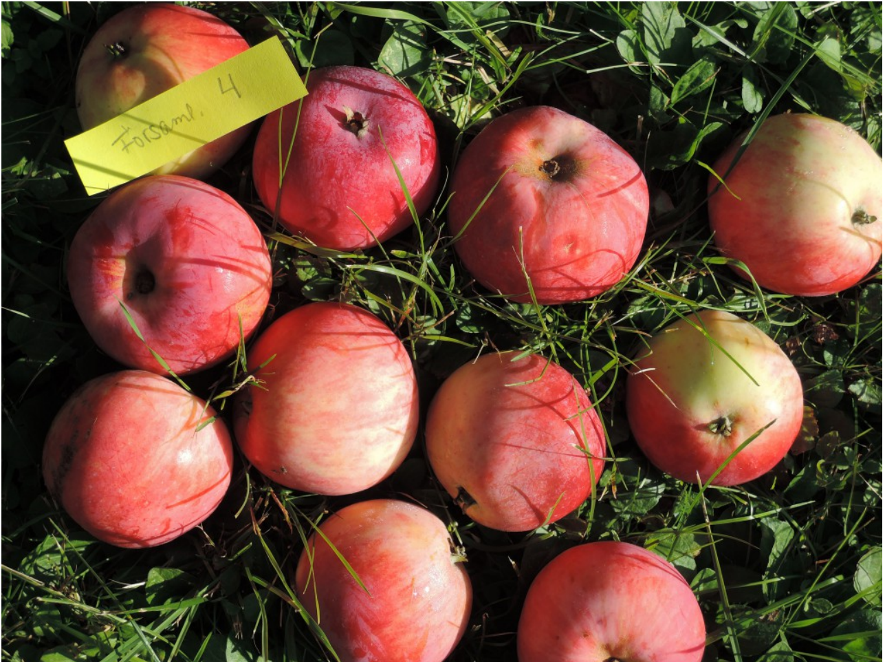
Stenvilla 4: Svensk Rosenhäger. Ett vackert äpple med stundom rosigt fruktkött.