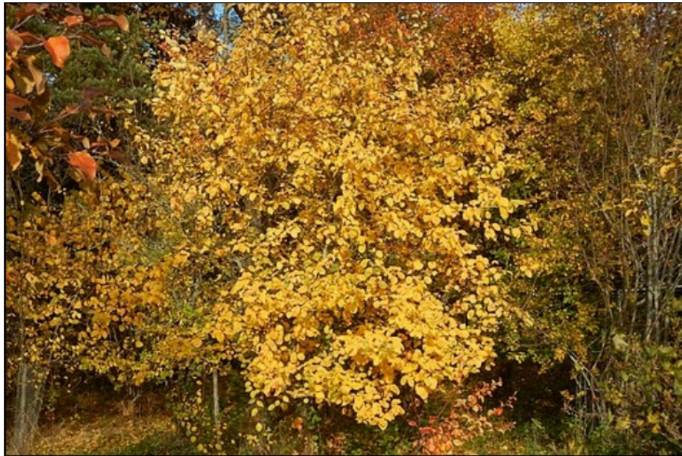
Höstfärger i oktober 2021