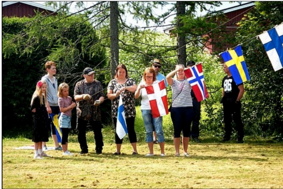
Flaggbindare för johannistandjin - 25 juni 2021