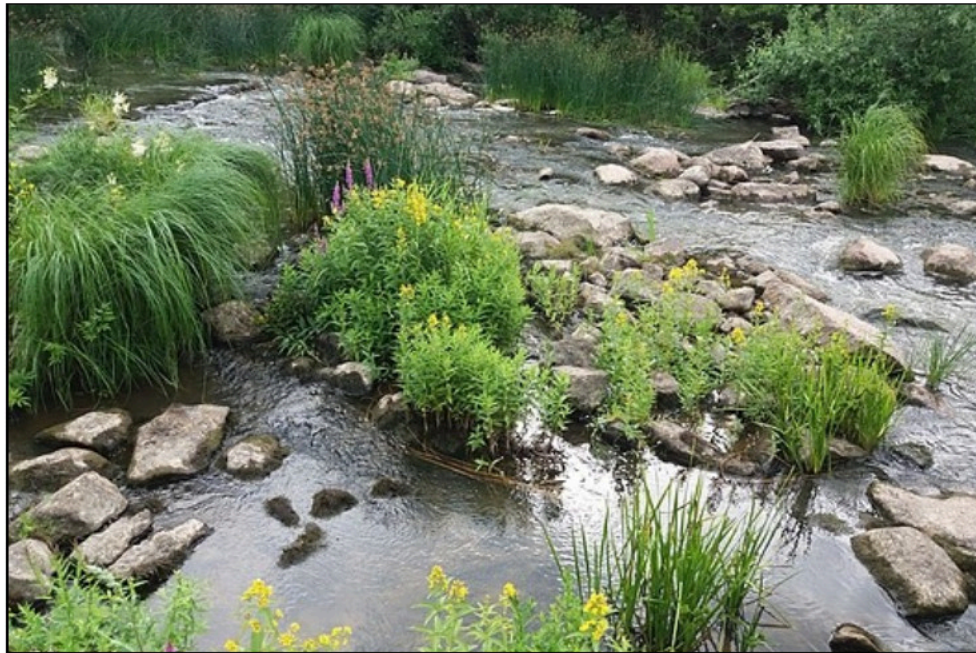
Bäckby (Siv Hollmén)