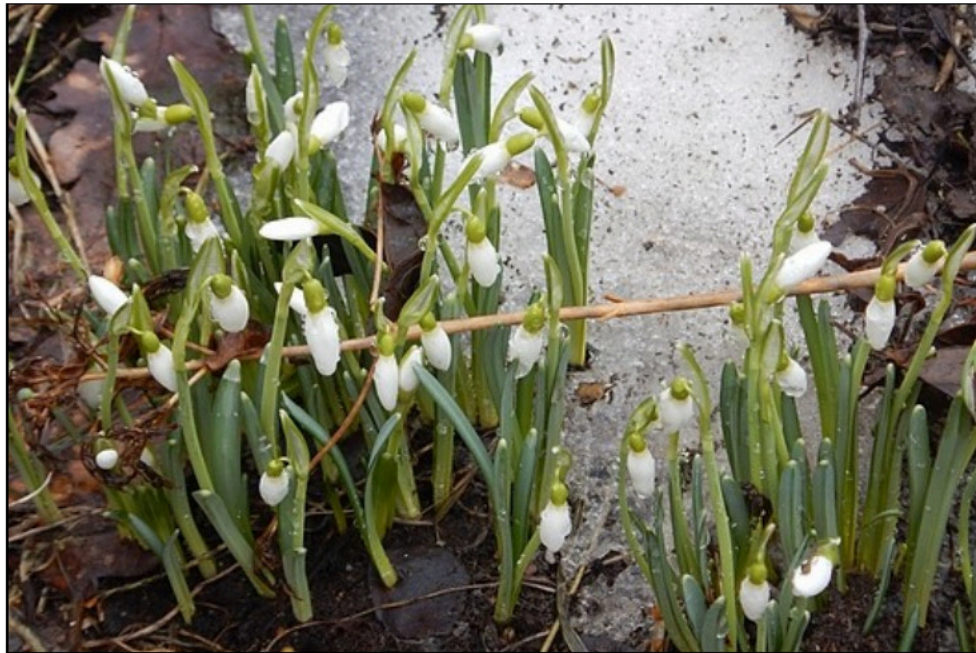
Snödroppar i början på april 2021