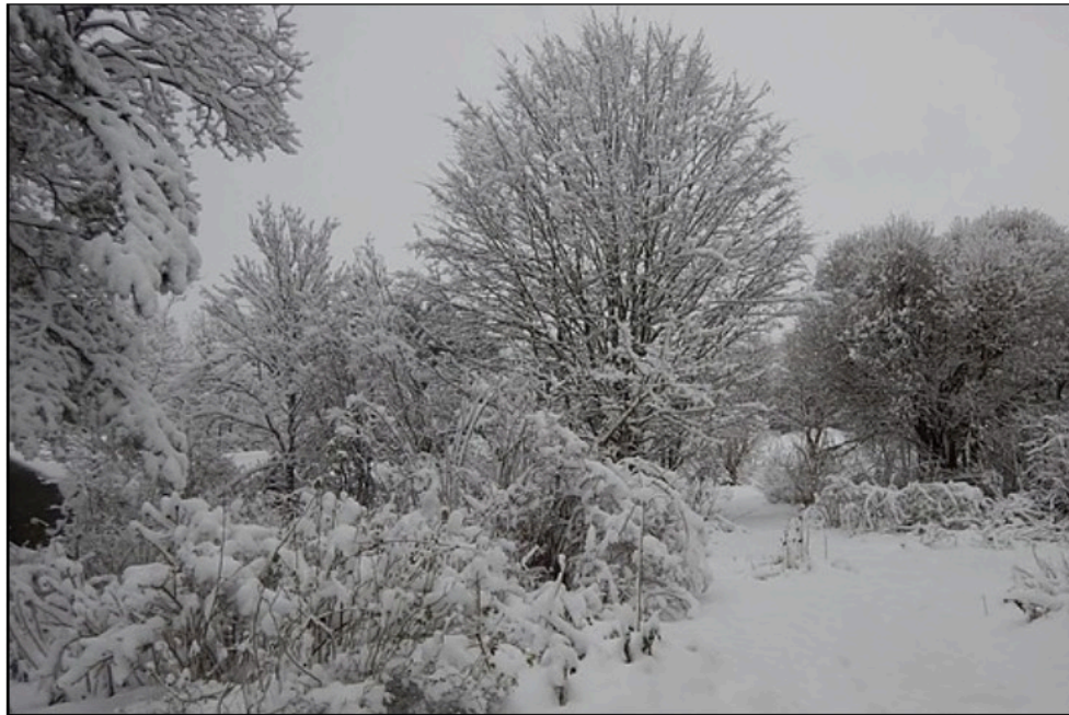
Snövinter - 3 januari 2021