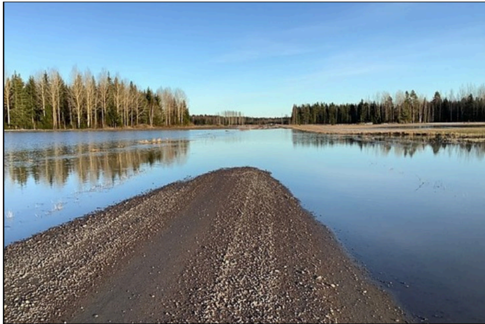
Mykelvatn som vi inte sett sedan årensningen: 31 mars 2021 i Baggkärret (Krille)