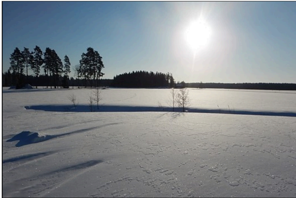
Sol och snö i februari 2021