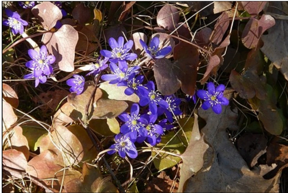
Sippoma blommade ovanligt länge - från början på april till mitten av maj 2021